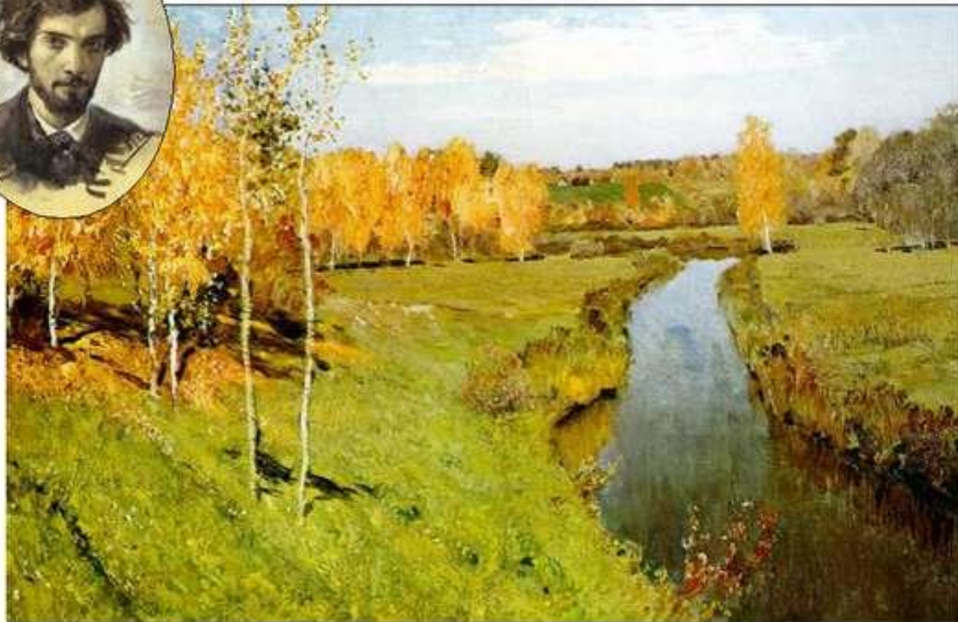
Золотая осень. Исаак Левитан