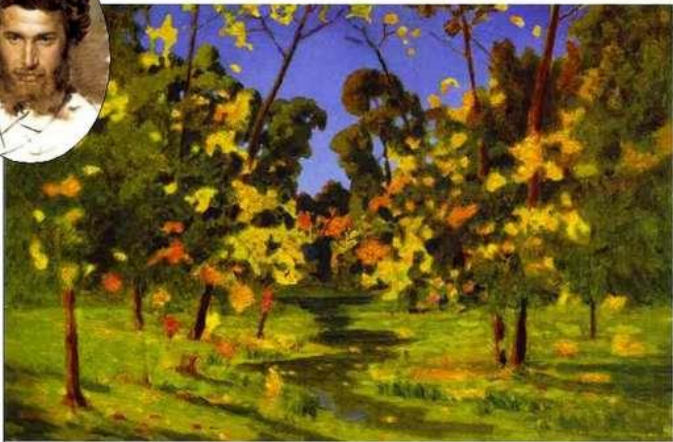
Осень. А.И. Куинджи