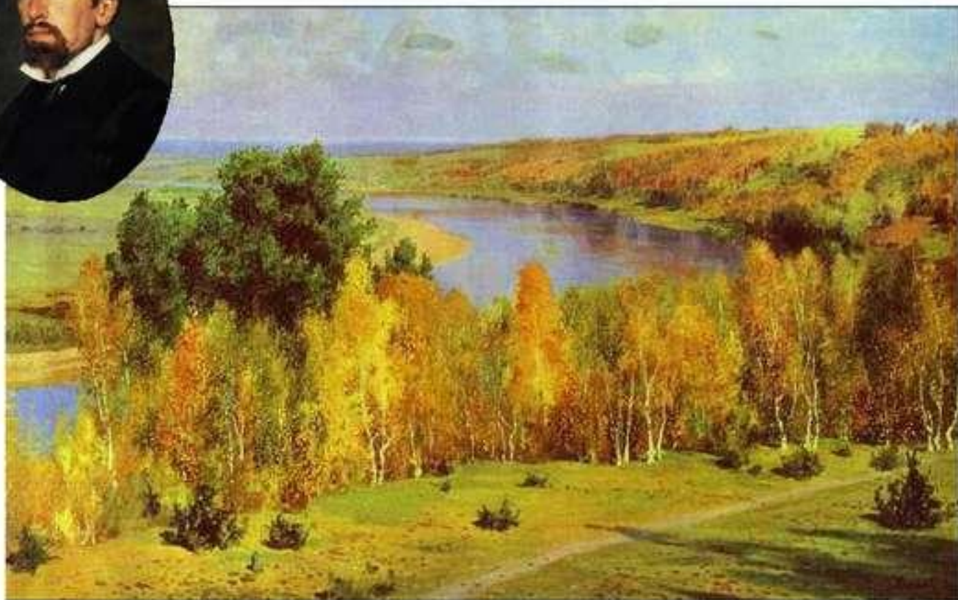
Золотая осень. Василий Поленов