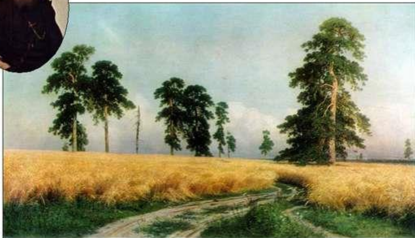
Рожь. И.И. Шишкин