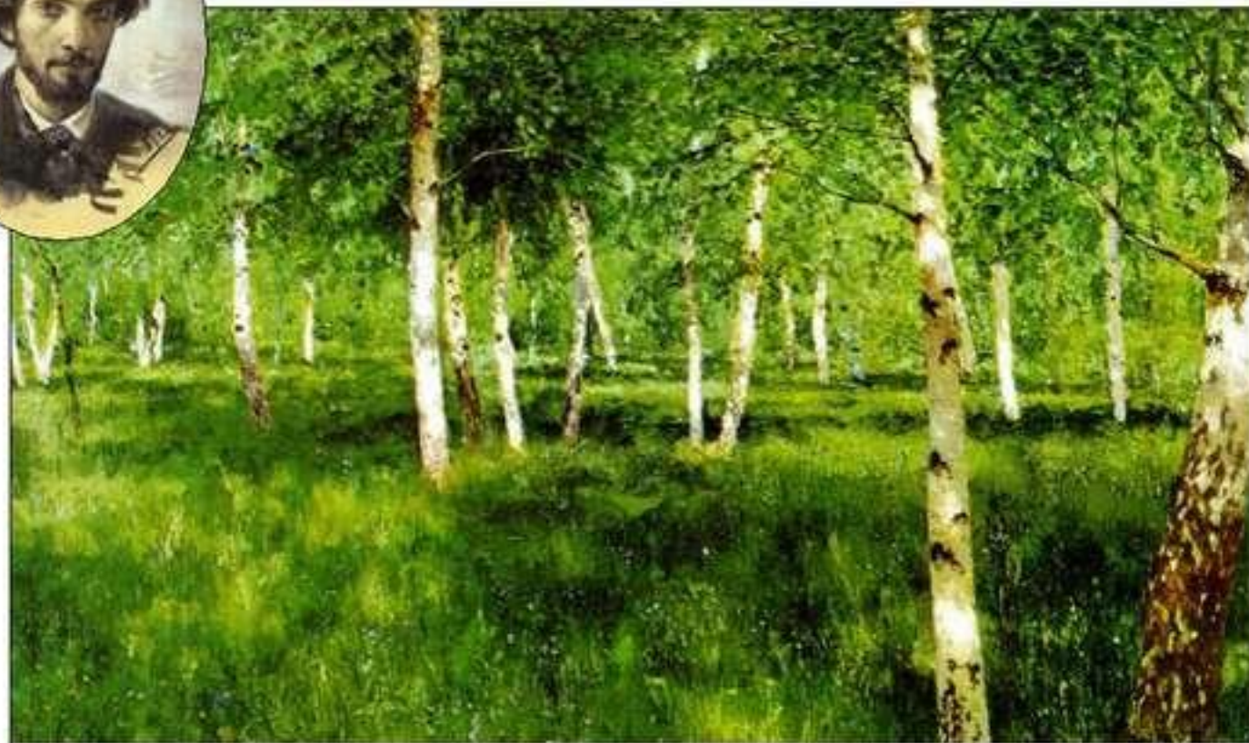
Берёзовая роща. Левитан