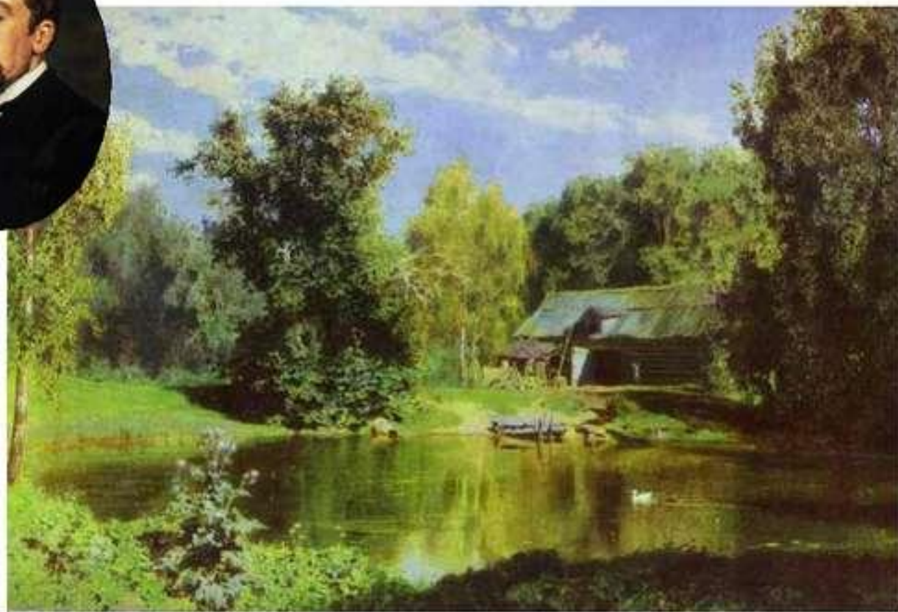
Вид на Абрамцево. Василий Поленов