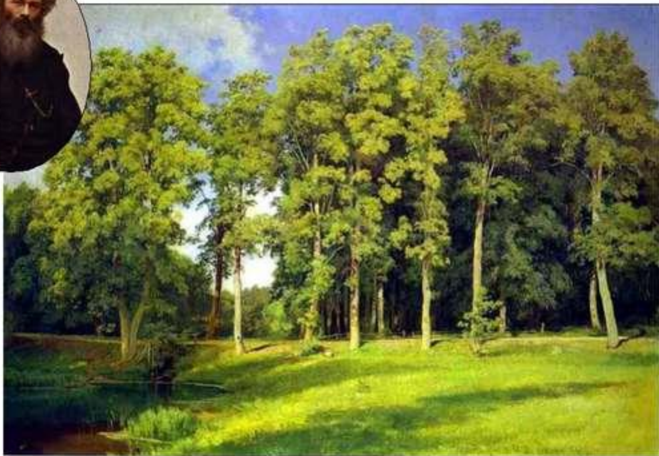
Пруд в роще. Преображенское. И.И. Шишкин