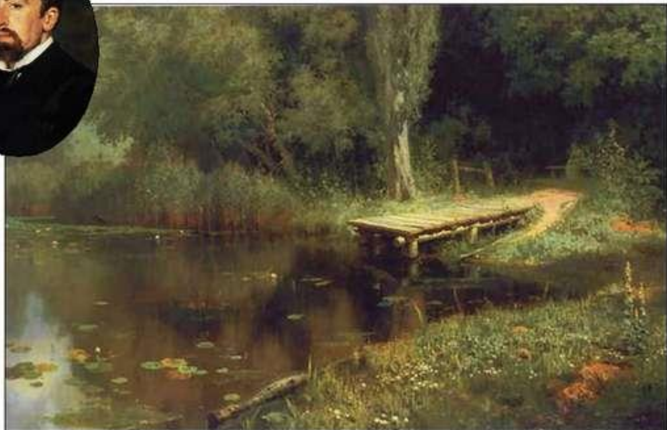
Заросший пруд. Василий Поленов