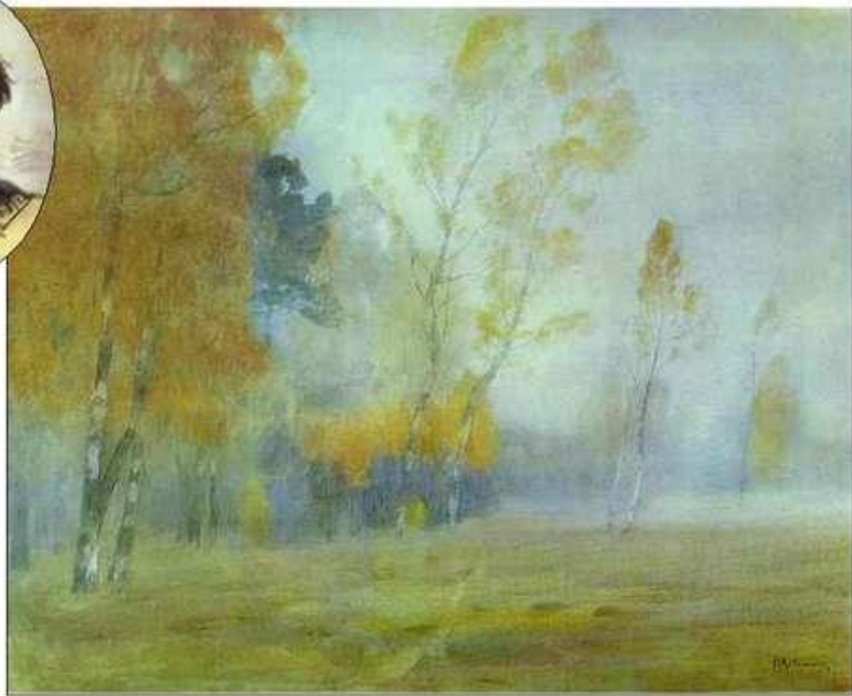
Туман. Осень. Исаак Левитан