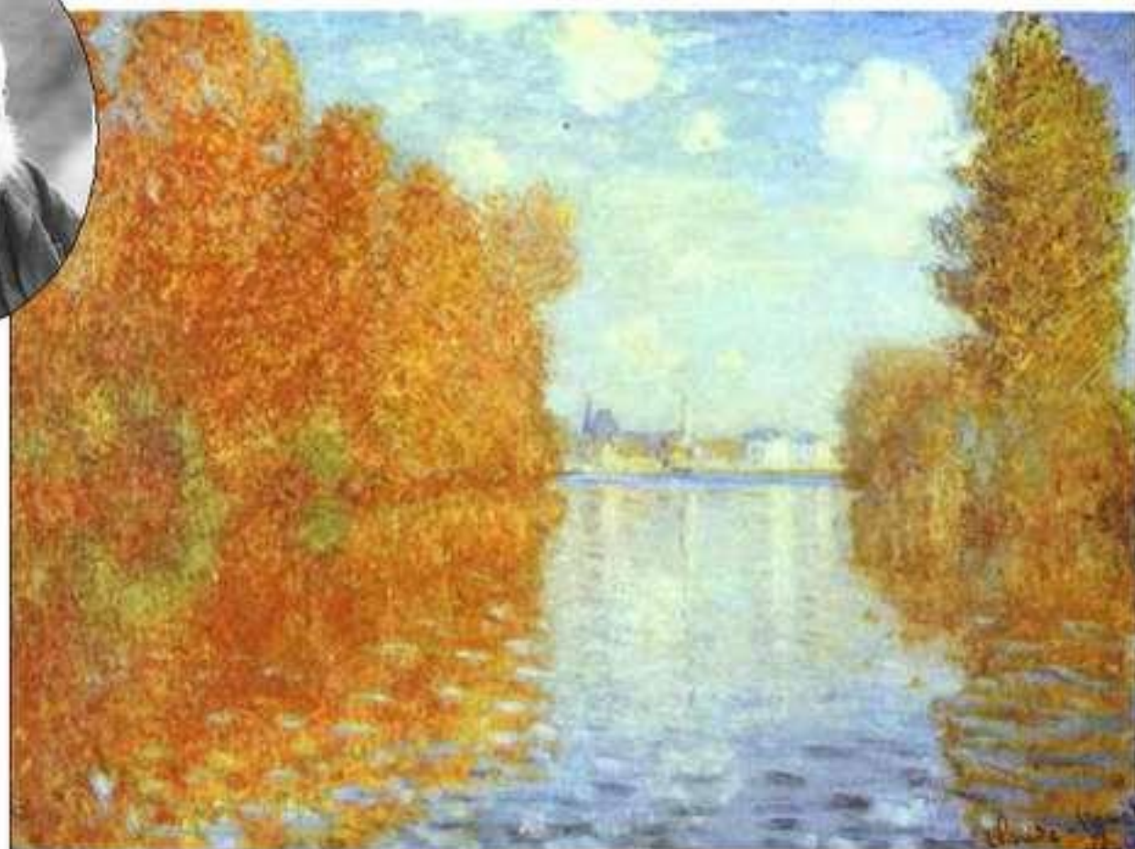
Осень. Клод Моне