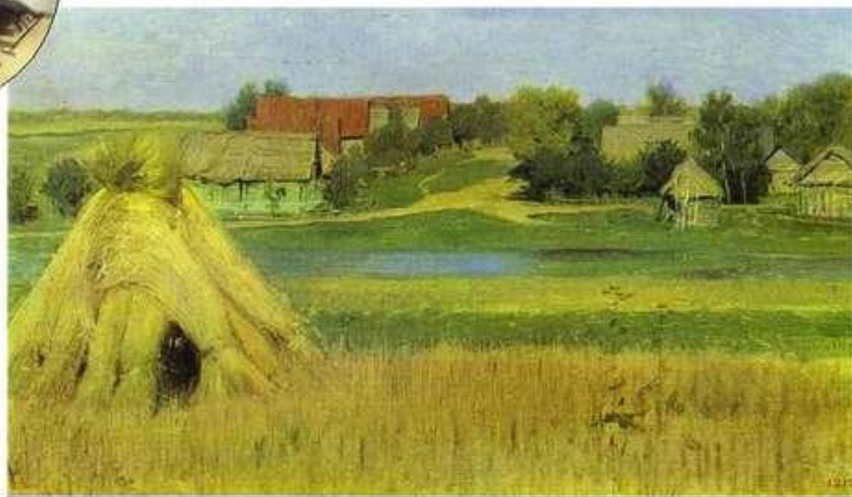
Сноп сена и деревня за рекой. Левитан