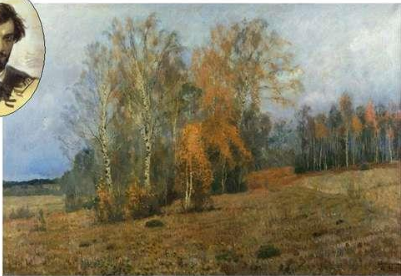
Октябрь. Осень. Исаак Левитан