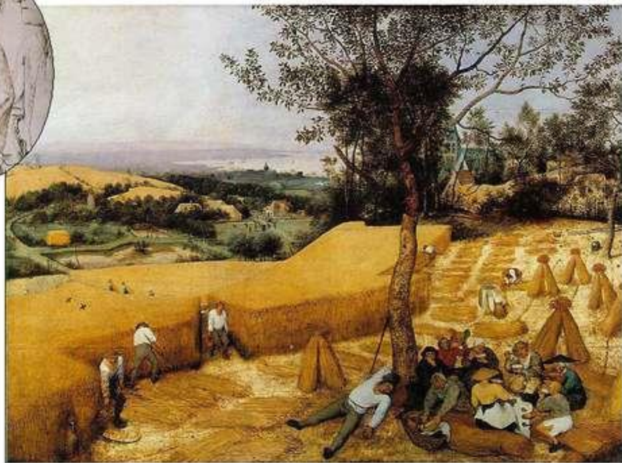
Жнецы. Брейгель Питер Старший