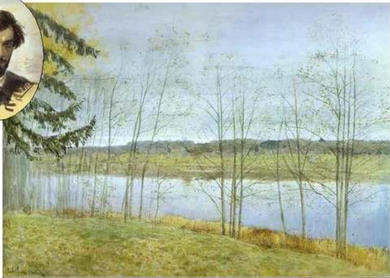
Осень. Исаак Левитан