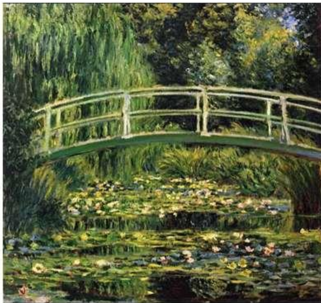
Белые кувшинки. Живерни. Клод Моне