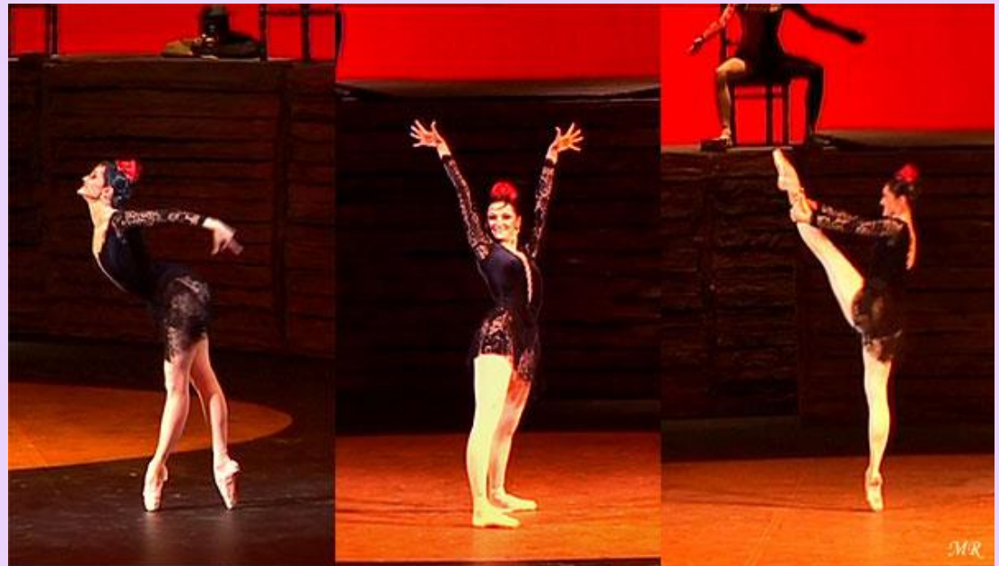
Майя Плисецкая — «Кармен»

В эпоху расцвета советского балета мастерами сцены были созданы незабываемые сценические работы, имеющие истинно художественную ценность.