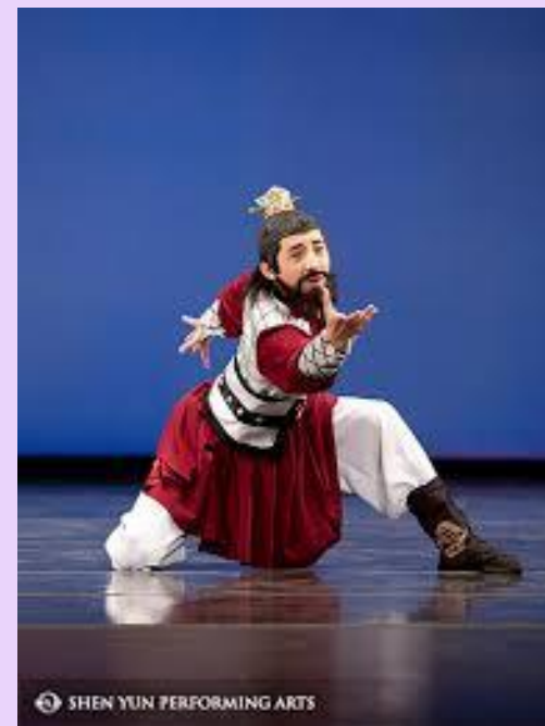
SHEN YUN PERFORMING ARTS