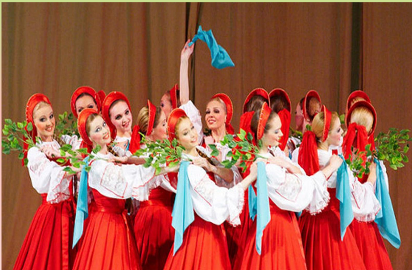
Рисунок танца. Круг