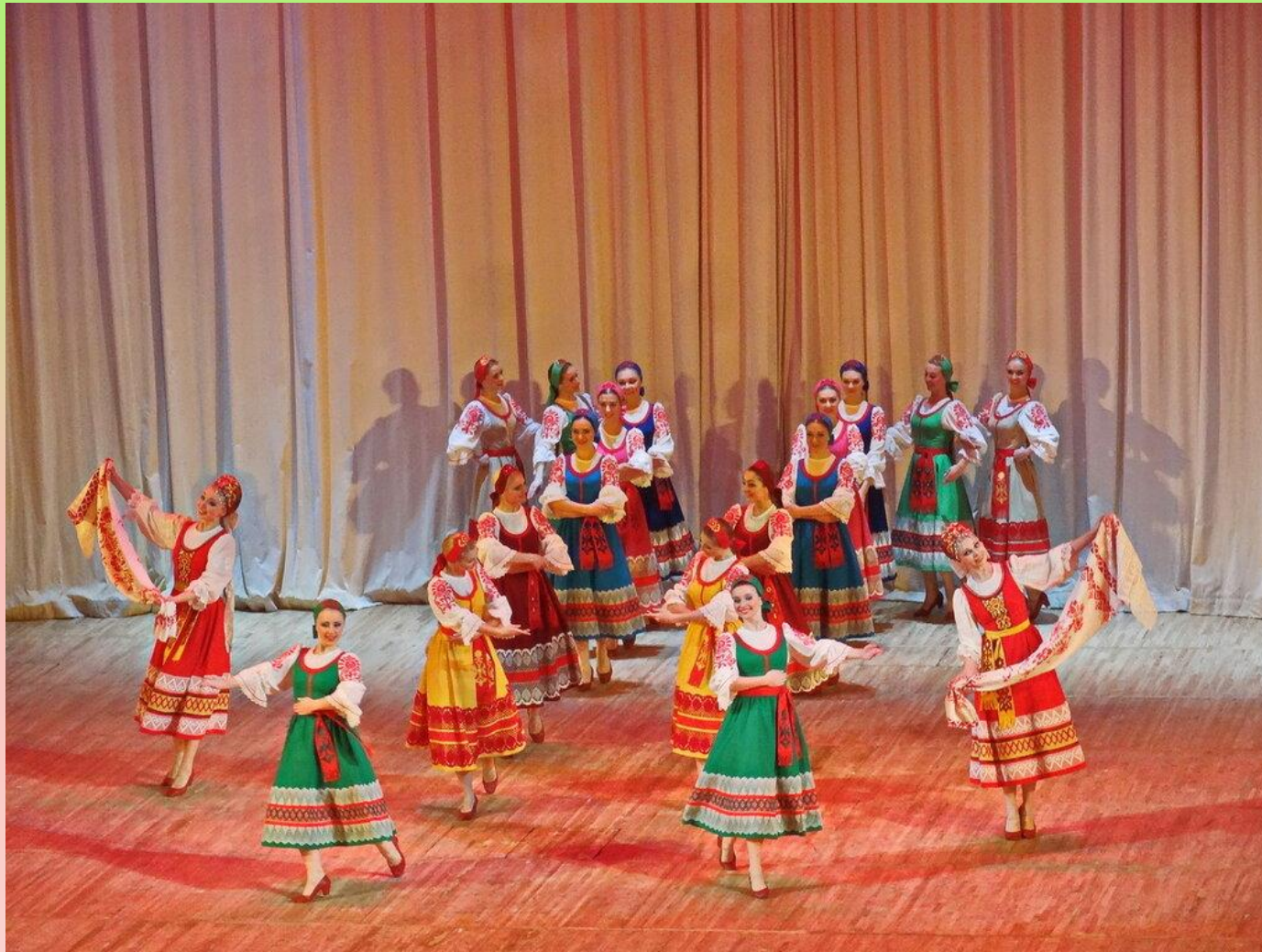
Рисунок танца. Фонтан