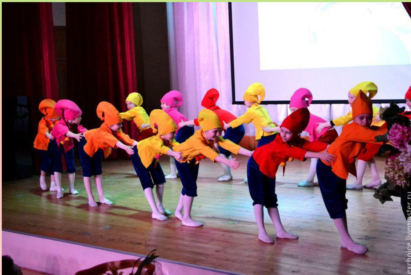
Рисунок танца. Колонна