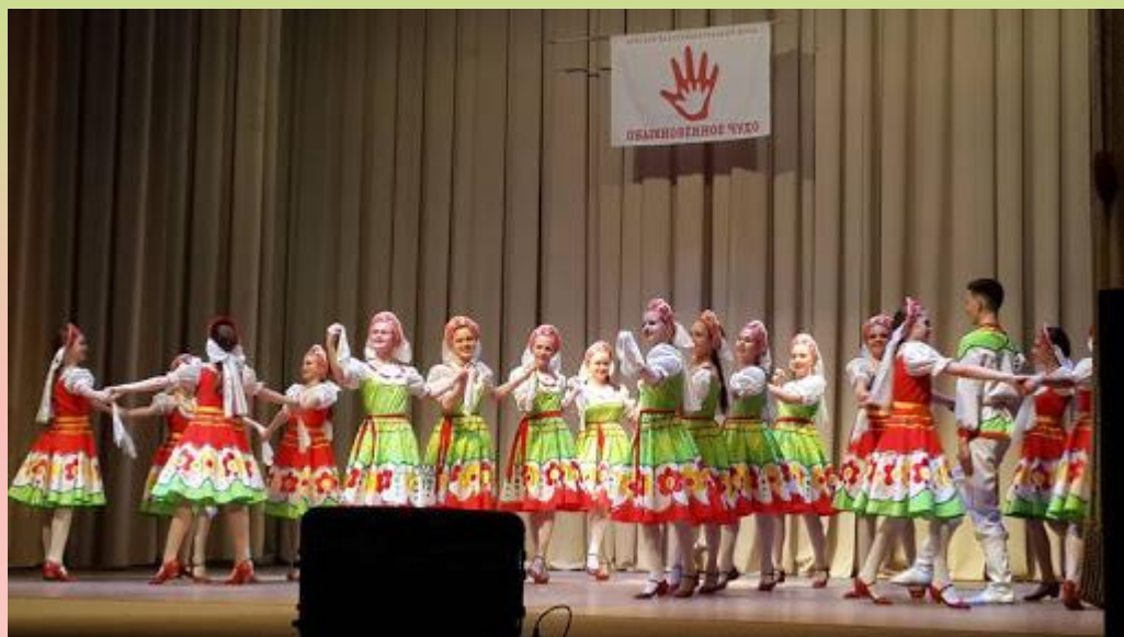
Рисунок танца. Прочёс