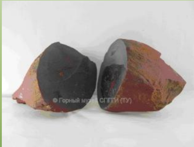
Вулканическая крученая бомба (в разрезе).