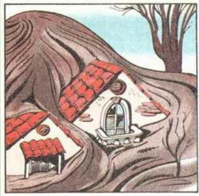
Вулканический пепел засыпал школу в Италии