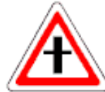
2.3.1 Пересечение со второстепенной дорогой