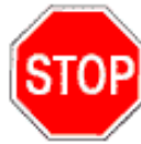
2.5 Движение без остановки запрещено