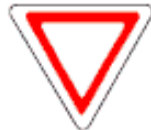
2.4 Уступить дорогу