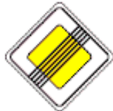
2.2 Конец главной дороги