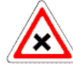
2.3.4 Пересечение равнозначных дорог