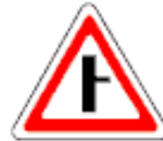
2.3.2 Примыкание второстепенной дороги