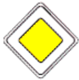
2.1 Главная дорога