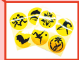
наклейки и значки