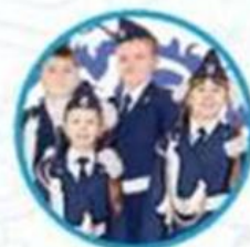
Юные инспектора движения