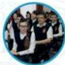
Юные помощники полиции