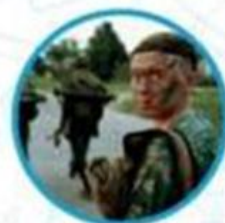
Юный спецназ Росгвардии